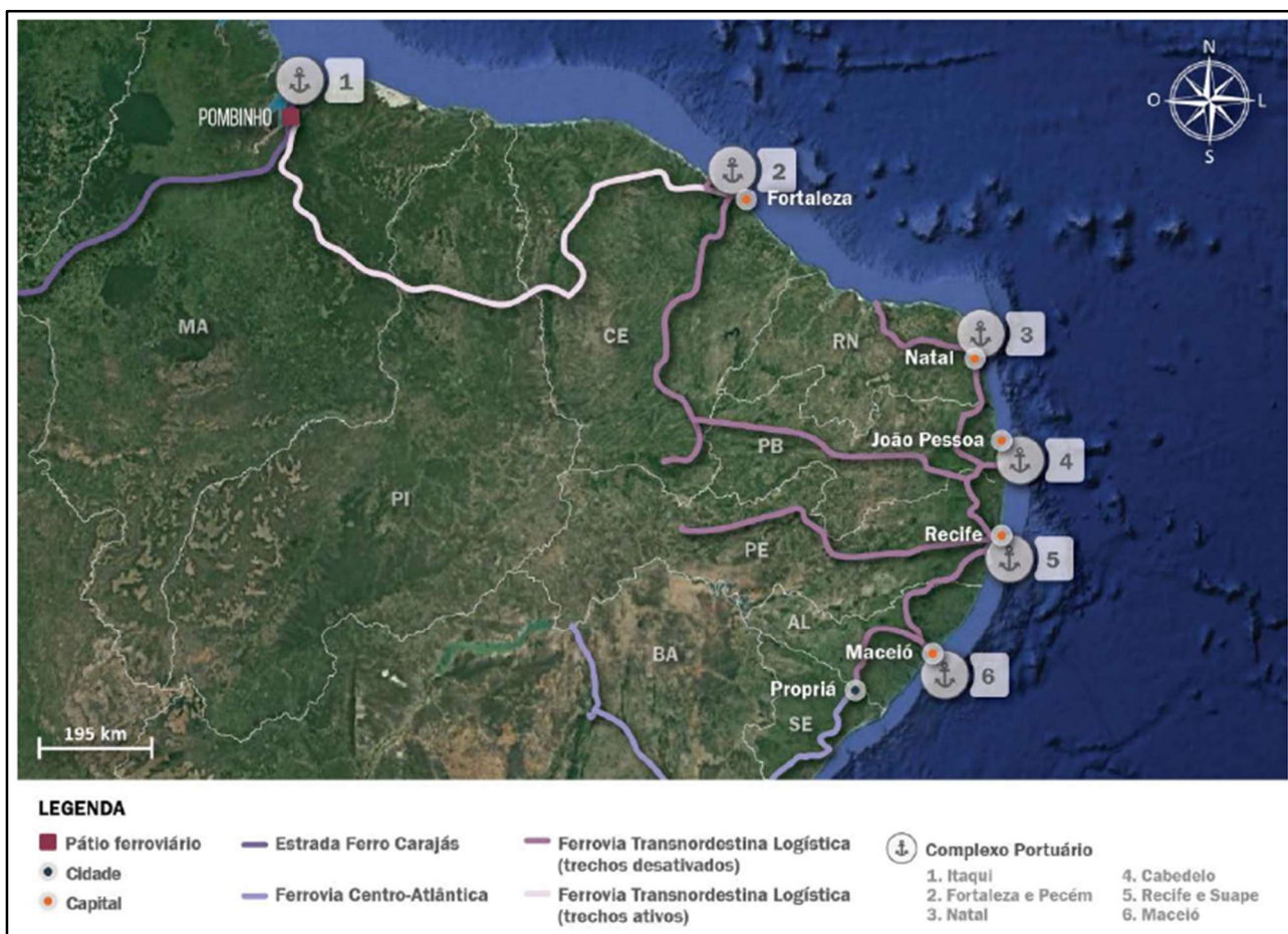
Figura 4: Malha ferroviária nordestina, com destaque para os trechos concedidos à Ferrovia Transnordestina Logística S.A. (FTL).

O acesso ferroviário é realizado a partir da Ferrovia Transnordestina Logística (FTL). A malha associada ao Complexo tem seu uso compartilhado com a Companhia Brasileira de Trens Urbanos (CBTU), que a utiliza exclusivamente para o transporte de passageiros. Não há registro de transporte de cargas pelo modal ferroviário no complexo há pelos menos dez anos. Além disso, atualmente não há linhas ferroviárias na área interna do Porto de Maceió. A figura a seguir apresenta o traçado da FTL no Nordeste do país.