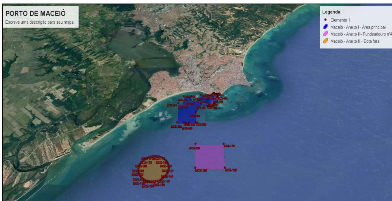
Figura 2: Poligonal do Porto Organizado de Maceió, conforme delimitado pela Portaria nº 504, de 05 de julho de 2019.

Em relação à poligonal do Porto Organizado de Maceió, em 5 de julho de 2019 o Ministério da Infraestrutura publicou a Portaria 504 que alterou seu traçado. Atualmente, a poligonal do Porto delimita a área de acordo com a imagem a seguir.