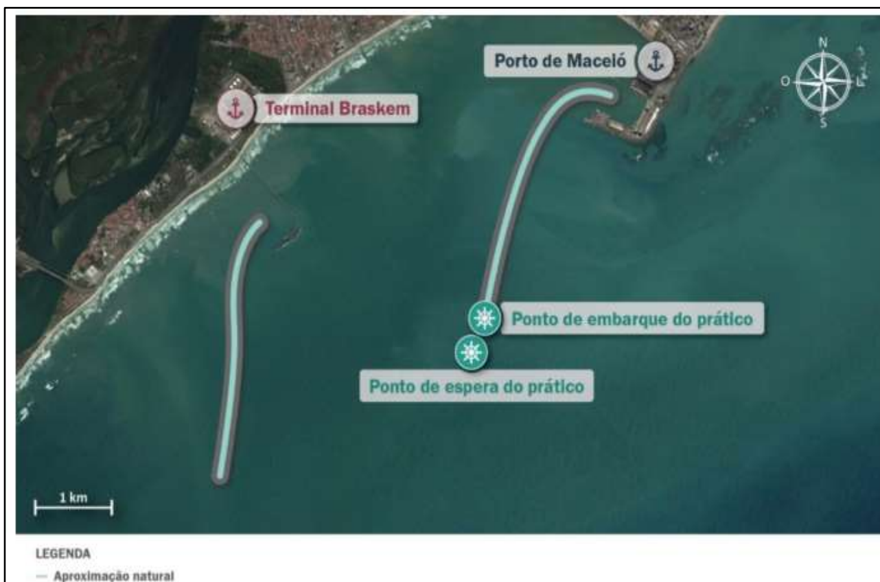
Figura 5: Acesso ao Porto de Maceió.

Atualmente o acesso ao Porto e ao Terminal Braskem é natural, sem canal delimitado, com profundidade de 11 metros. A figura a seguir apresenta de forma esquemática os traçados dos acessos aquaviários do Complexo Portuário de Maceió: