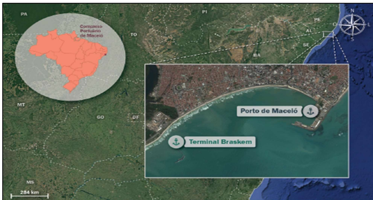
Figura 1: Localização do Complexo Portuário de Maceió.

Em relação à poligonal do Porto Organizado de Maceió, em 5 de julho de 2019 o Ministério da Infraestrutura publicou a Portaria 504 que alterou seu traçado. Atualmente, a poligonal do Porto delimita a área de acordo com a imagem a seguir.