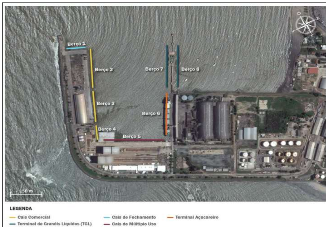
Figura 6: Localização dos berços do Porto de Maceió Portuário de Maceió.

A tabela a seguir apresenta as principais características dos berços do Porto de Maceió.